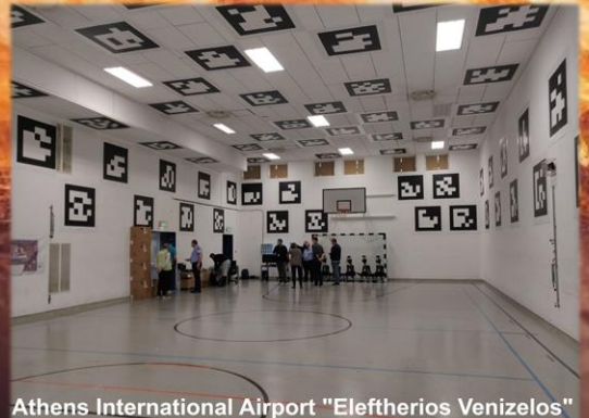
Athens International Airport "Eleftherios Venizelos"